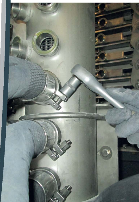
Full-Service aus einer Hand, auch bei der Instandsetzung von fördertechnischen Anlagen