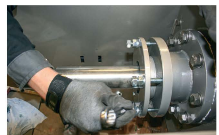
Wartung und Montage-Service